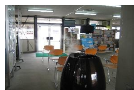
次亜塩素酸噴霧器