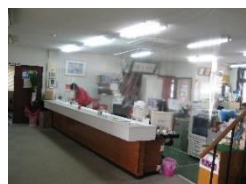
受付に飛沫感染防止カーテン

当校として、できる限りの感染防止策を行って参りますので、ご理解とご協力のほど何卒宜しくお願い致します。