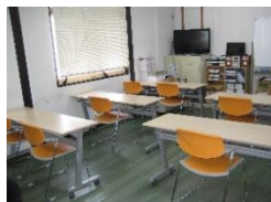
ソーシャルディスタンスを考慮した学科教室